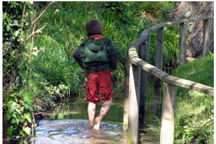
Die Lohburg beherbergt ein Internat | Kleiner Münsterländer beim Wassertreten