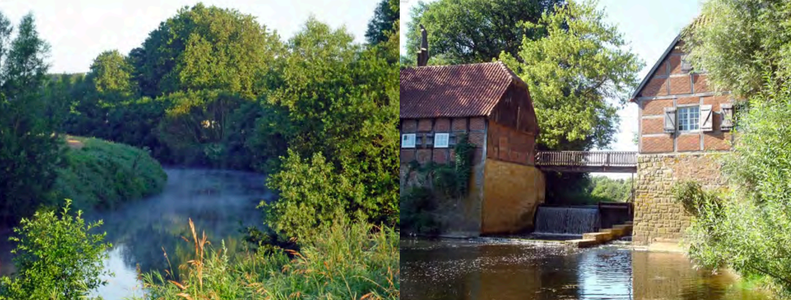
Die Emsaue | Westfälische Wassermühle