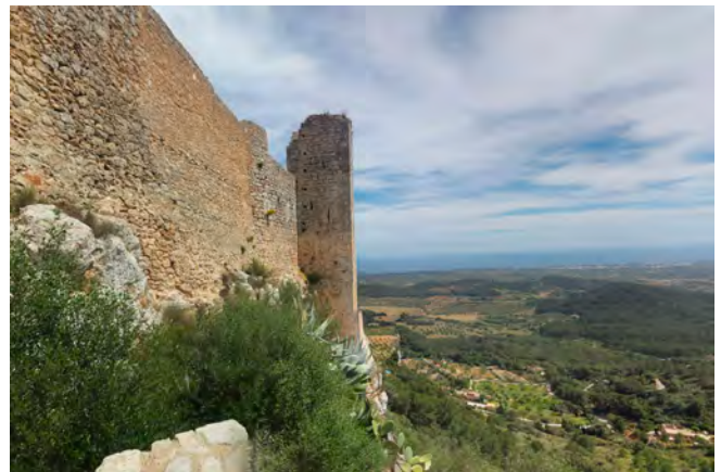
Festung bei Porto Petro

Für unsere Tour begeben wir uns nach Porto Petro in das kleine Hotel Na Martina, ländlich gelegen und nur für uns. Von Vorteil ist es, wenn Ihr Doppelzimmer bucht, ich habe bereits sechs Einzelzimmer in der Anmeldung, ohne dass es eine Einladung gegeben hat. Weil das Na Martina begrenzte Kapazitäten hat, gehen die Einzelzimmer zu Lasten der Gruppengröße.