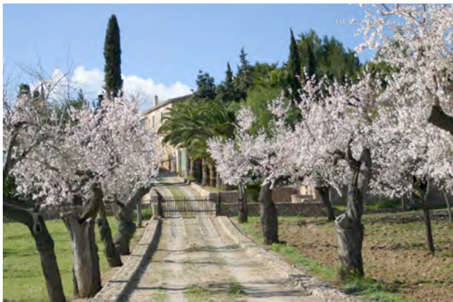
Mandelblüte bei Artà

Liebe Freundinnen, liebe Freunde, unsere ersten Mallorca Touren führten uns vor etwa 15 Jahren in der Zeit der Mandelblüte über die Insel. Ende Februar sind wir fast am Ende der Mandelblüte, dennoch werden um diese Zeit eine blühende und grünende Insel erleben, die wir in vollen Zügen genießen mit schönen Ausfahrten durch kleine Camis, die durch unzählige mallorquinische Gärten führen. Schwerpunkt der Last Edition wird eine Region sein, die wir bisher nicht so häufig gefahren sind, wir wollen von Porto Petro aus den östlichen Teil der Insel erkunden, dort gibt es jede Menge Kurven und mittelhohe Berge in der Region zwischen Manacor und Cap de Pera. Selbstverständlich lassen wir auch die kurvenreiche Tramuntana Region nicht aus.