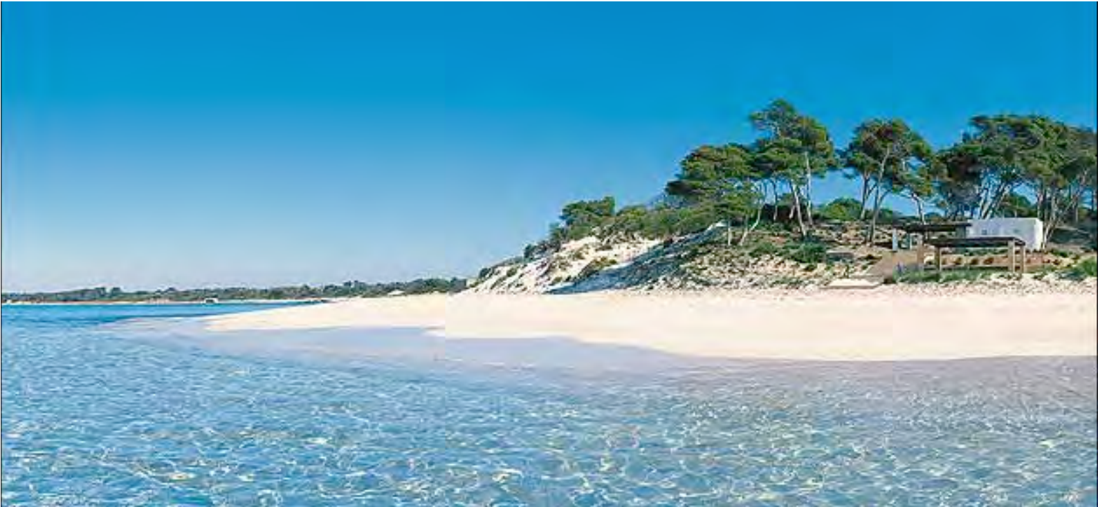
Es Trenc, der größte Naturstrand

Motorradkleidung und Helme nimmt man von zu Hause mit.