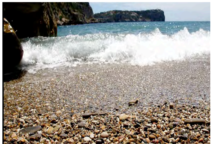
Das Meer bei Sa Calobra